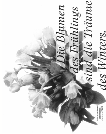
Khatti Gibran (1883-1931), christlich-libanesischer Schriftsteller und Maler