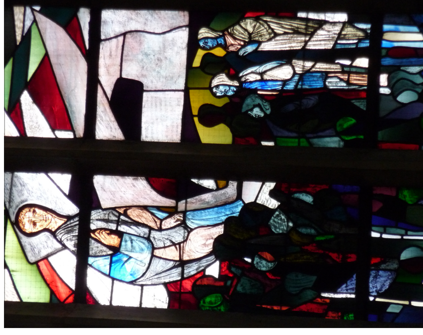
„Fürchtet euch nicht!“ (Matthäus 28,5) Detail des Osterfensters (südliches Seitenschiff)