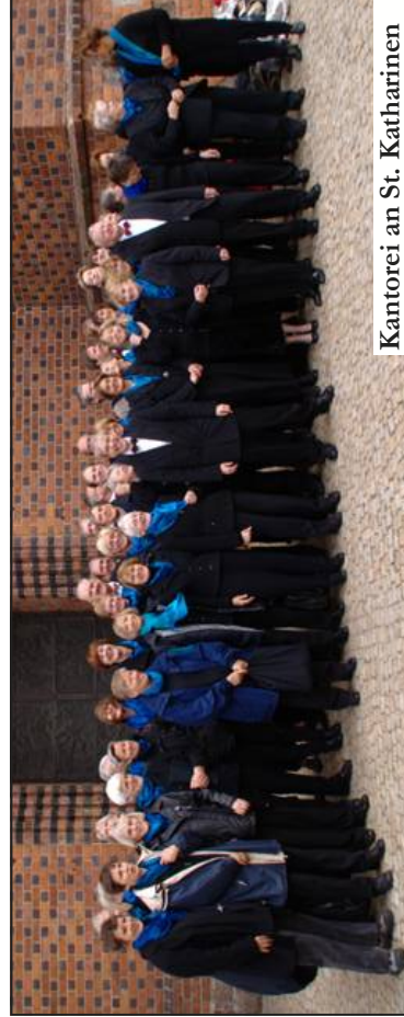
Kantorei an St. Katharinen

Neben der musikalischen Gestaltung des Gottesdienstes dort im Dom singt