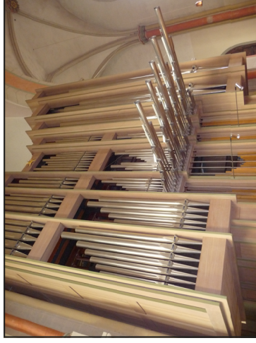
v. Beckerath-Orgel in St. Katharinen